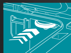
Geheimfach für Sicherheitstracker